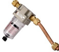
500.176 Nem Filtresi (Küçük)