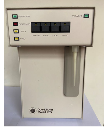
Duo-Diluter 125 Diluter