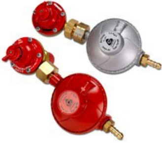
500.178 Bütan Regülatörü 500.179 Propan Regülatörü