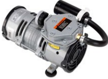
8515 Hava Kompresörü