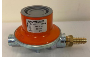
500.180 Doğal Gaz Regülatörü