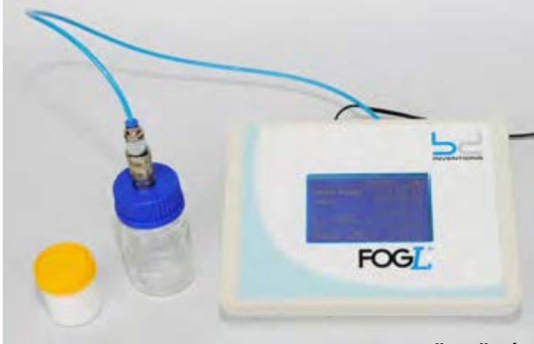
MODEL FOGI BENCHTOP TYPE * MASAÜSTÜ TİPİ

Determination of the total inorganic carbon in soil as equivalent calcium carbonate content in the lab