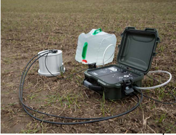
MODEL DUALHEAD * IN FIELD/ARAZİDE

DualHead İnfiltrometre, doymuş toprakta hidrolik iletkenlik, veya Kfs ölçer.