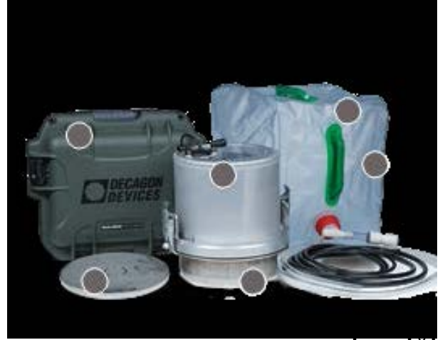
PACKAGE CONTENTS / PAKET İÇERİĞİ

An automation of the method used by Reynolds and Elrick (1980) and others.