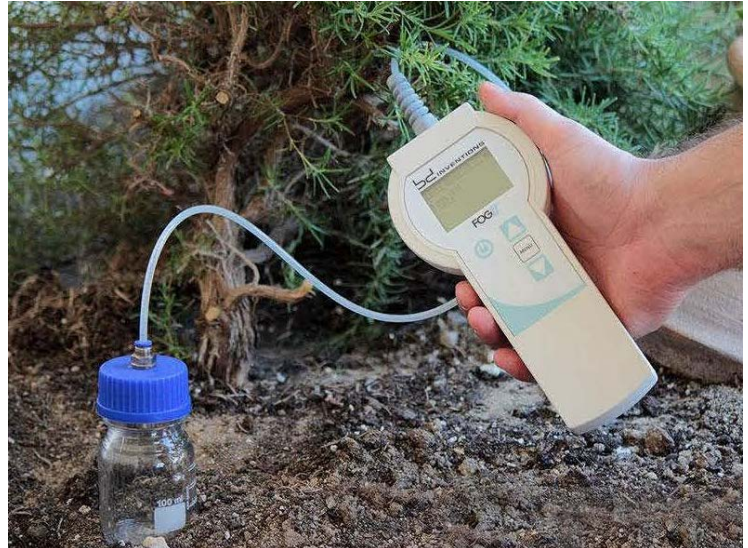
MODEL FOGII PORTABLE TYPE * PORTATİF TİPİ

Otomatik Sıcaklık Düzeltilmesi (patentli)