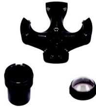
Max. kapasite: 4 x 200 ml Sipariş numarası: 220.71 V20