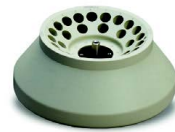
Max. kapasite: 30 x 15 ml Sipariş numarası: 221.19 V20

Tablolarda rotorların max. kapasiteleri gösterilmiştir. Doğal olarak daha küçük hacimler için adaptörler mevcuttur. Detaylı bilgiyi web sayfamızda bulabilirsiniz www.bilmar.com.tr Eğer aradığınız adaptör yoksa, sizin için özel bir adaptör yapmaktan mutluluk duyacağız.