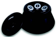
Max. kapasite: 6 x 85 ml Sipariş numarası: 220.78 V21