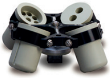
Max. kapasite: 4 x 145 ml Sipariş numarası: 221.12 V20