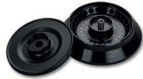
Hermetik Sızdırmaz-PPS Kapak Max. kapasite: 24 x 1,5/2,0 ml Sipariş numarası: 220.87 V22