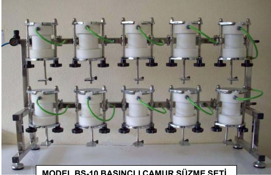
MODEL BS-10 BASINÇLI ÇAMUR SÜZME SETİ

Saturasyon çamuru süzmek için, ihtiyacınıza ve yer durumuna göre 10-75 adet numuneyi aynı anda ve basınçla süzecek özel-dizayn modellerimiz mevcuttur.